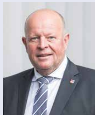
Bürgermeister Konrad Pieringer

Liebe Grüße aus dem Gemeindeamt, Bürgermeister Konrad Pieringer