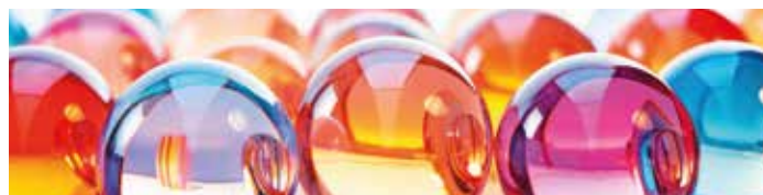
Infoblatt Forum Familie